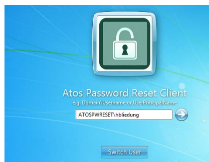
Abb. 2 - DirX Identity Passwort Reset mit dem Atos Password Reset Client